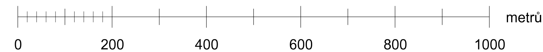
A6. Výkres veřejně prospěšných staveb, opatření a asanací